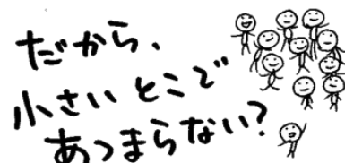
イラスト: 西澤真樹子

自然系や人文系など、様々な分野を対象としたミュージアムが各地にあり、日々活動しています。それらの多くは、職員が数名という小規模な施設。それぞれの持つ力は大きいとはいえません。そこで、「小規模ミュージアム＝小さいとこ」に関わっている人や、応援したい人が集まって「小さいとこ」の魅力を発信し、それぞれの交流や情報交換、支援など、みんなで集まって協力しよう！というのが、この小規模ミュージアムネットワーク(＝小さいとこネット)。その交流活動として、年1回開催されるのが「小さいとこサミット」です。